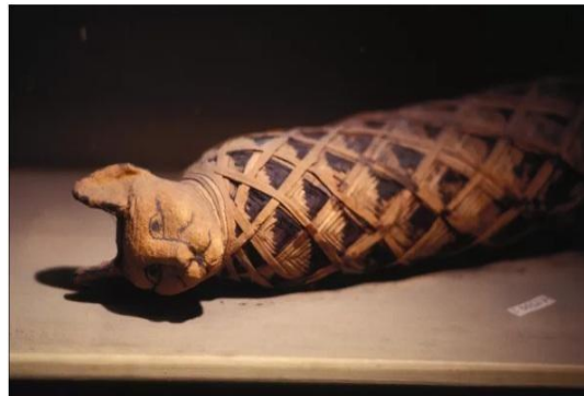
Xác ướp mèo

So với con chó khôn ngoan thì con mèo là một con vật tinh ma, quỷ quái, nhất là trong chuyện ăn vụng. Sau 1975 ông hàng xóm nhà Sao Khuê nuôi một con mèo xám, mắt thì xanh lè mà mặt thì kên kên, chuyên môn ăn vụng. Tủ lạnh không còn dùng được nên thức ăn phải để ở bên ngoài, trong nồi, dù có chặn bằng những vật nặng, nó cũng đẩy ra và sạch hết. Sao Khuê kiếm một cái trạn. Trời! nó cũng mở được cái móc gài trạn bằng cách leo lên đầu trạn, khều cái móc ra, chui vào mà ăn. Bị đánh và bị mắng nó bèn trả thù bằng cách mỗi