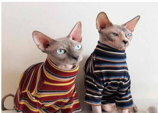
Mèo Ai Cập

Mèo Ai Cập (hay mèo Sphynx, mèo không lông, mèo nhân sư) mà giá bán ở Việt Nam bây giờ trên 4 triệu là kết quả từ đột biến gen tự nhiên từ mèo mẹ ở Canada. Chú mèo Canada này vốn dĩ bình thường với bộ lông đen trắng nhưng sinh ra mèo con không lông, có vẻ ngoài trắng kỳ lạ. Người ta đặt tên cho chú mèo con này là Prune. Thời gian sau, họ tiếp tục cho Prune giao phối với mèo mẹ (loạn luân thật) và tạo ra thêm nhiều chú mèo con khác cùng đặc điểm không lông như vậy. Tên gọi Sphynx được các nhà lai tạo đặt cho chúng, bởi vẻ ngoài loài mèo này nhìn tương đồng với tượng điêu khắc ở Ai Cập (Great Sphynx of Giza). Năm 2005, mèo không lông Ai Cập được công nhận trên thế giới dưới tên một giống mèo riêng biệt, với vẻ ngoài kỳ lạ nhất.