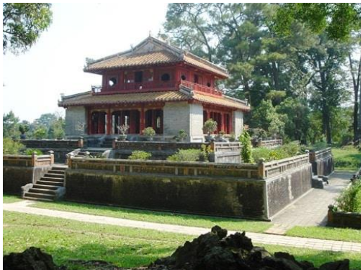
Lăng vua Minh Mạng.

Trẫm nuôi dân như con, thực không kể phí tổn. Nhưng bọn quan lại tham lam giao quyết, ngấm ngấm chừa đầy túi riêng, mà kẻ quan quả cô độc lại không được thấm nhuần ơn thực. Gần đây Huỳnh Công Lý làm Phó Tổng trấn Gia Định không bao lâu mà bóc lột của dân trên ba vạn. Nếu các viên mục thú đều như y cả, thì dân ta còn nhờ cậy vào đâu. Trẫm dẫu có lòng sẵn xót thương xót cũng không làm thế nào được.