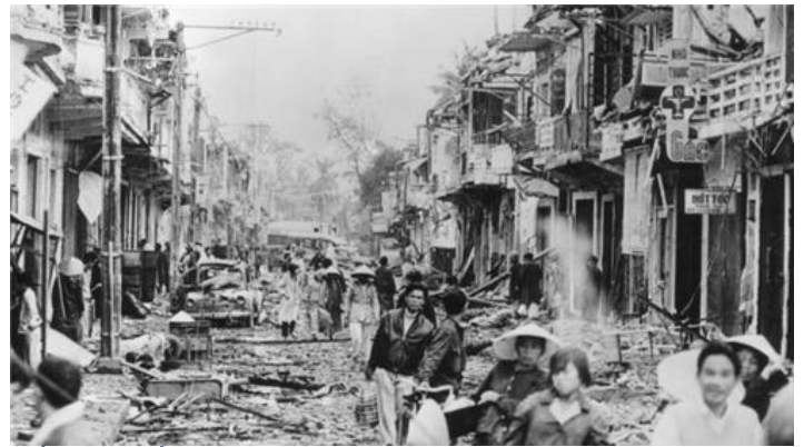
Trở về nhà sau trận chiến tại Huế

Khi quân Bắc Việt mở cuộc tấn công cuối cùng tiến tới thống nhất đất nước hồi 1975, hàng trăm ngàn dân thường ở miền Nam Việt Nam đã bỏ chạy. Dường như trong tâm trí nhiều người, câu chuyện về "những vụ thảm sát ở Huế" vẫn còn đậm dấu ấn.