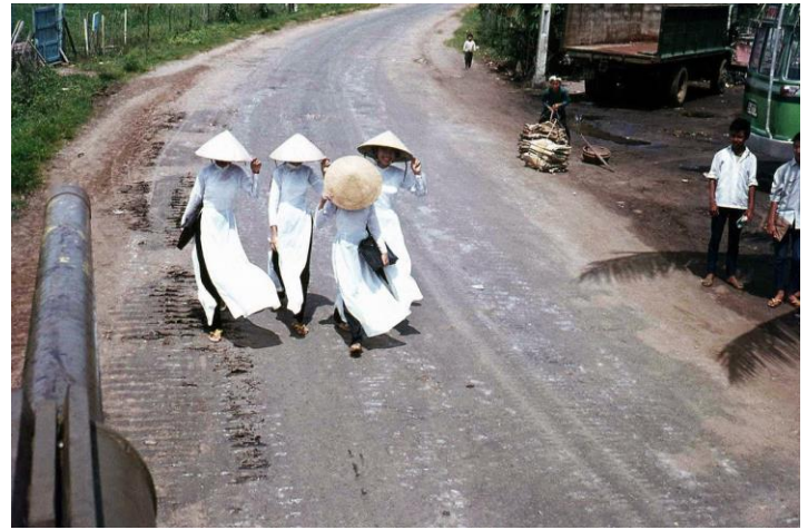
Học trò tỉnh lẻ

Ngôi trường trung học đầu tiên tại miền Nam là Collège Chasseloup-Laubat, thành lập năm 1874 sau này đổi thành trường Lê Quý Đôn, tiếp đến là Collège de My Tho (1879), sau đổi tên là Nguyễn Đình Chiểu. Ở Huế có trường Quốc Học dành cho nam sinh được thành lập từ năm 1896 và trường Đồng Khánh được dành cho nữ, thành lập từ năm 1917.