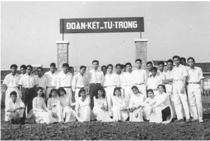
Học trò xứ BMT