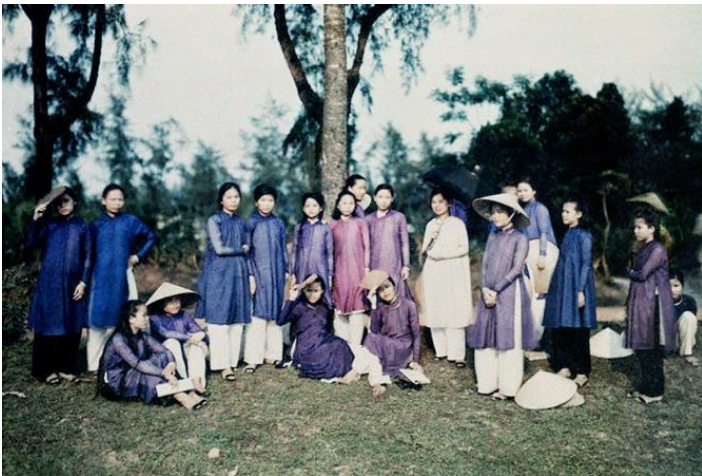
Nữ sinh Đồng Khánh (năm 1931)

Thoạt đầu trường Đồng Khánh chỉ có cấp tiểu học với với đồng phục màu tím nên còn được gọi là “Trường Áo Tím”. Dưới thời Pháp thuộc đồng phục đổi sang màu xanh nước biển và bắt đầu từ Đệ nhất Cộng hòa có đồng phục màu trắng.