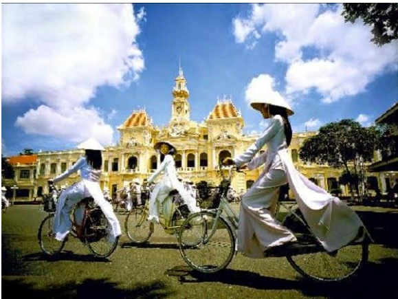
Nữ sinh trên xe đạp trước Tòa Đô Chánh

Hồi xưa nữ sinh còn đội nón lá đến trường, ít có những kiểu mũ “mô đen” như ngày nay. Mỗi lúc tan học là cả một đàn bướm trắng bay ra rồi tỏa đi khắp các con đường. Nhà gần thì ôm cặp đi bộ để các anh như Phạm Thiên Thư đưa vào thơ. Nhà xa thì đạp xe theo từng nhóm như trong bức hình dưới đây trước Tòa Đô Chánh.