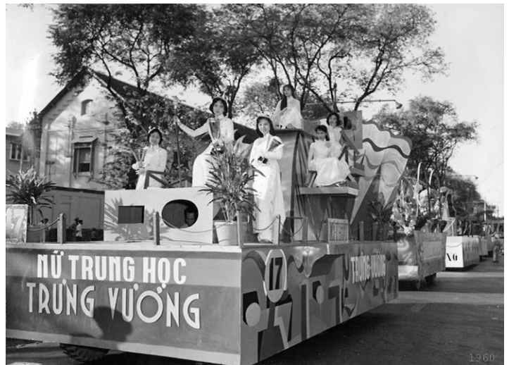
Xe hoa của trường Trưng Vương nhân ngày Phụ nữ Việt Nam năm 1960

Nổi bật nhất tại Sài Gòn là hai trường Gia Long và Trưng Vương, những địa chỉ được các “cây si” thường xuyên lui tới. Gia Long còn được gọi là trường “Nữ sinh Áo Tím” ngày nay là trường Nguyễn Thị Minh Khai, được thành lập từ năm 1915 và thuộc loại “lão làng” trong hệ thống giáo dục của Hòn ngọc Viễn đông.