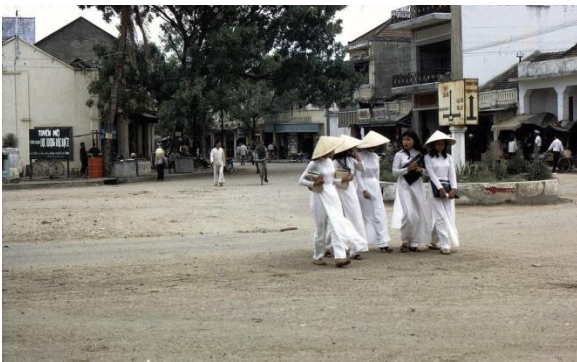
Nữ sinh miền thùy dương cát trắng Nha Trang

Chắc chắn nàng đã đọc, không những thế, ngoài hai đứa còn có người thứ ba cũng đã đọc, đó là thầy tổng giám thị. Ông “tể nhị” gặp riêng tôi và cảnh cáo cần phải chấm dứt trò chơi “nguy hiểm” này, nếu tái phạm tôi sẽ bị “cấm túc” và thông báo về gia đình.