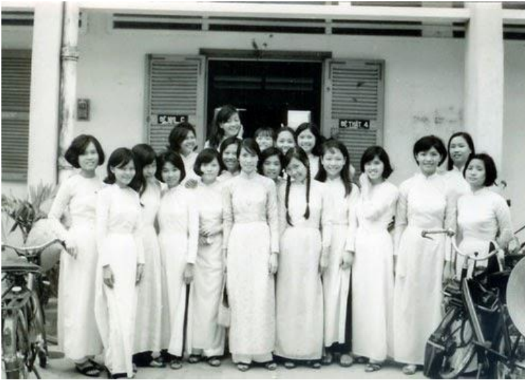
Nữ sinh bên chiếc Velo Solex

Trong thơ Phạm Thiên Thư có cảnh nên thơ giữa hai học trò “trao vội chùm hoa, ép vào cuốn vở” còn tôi thì chơi trội hơn, viết luôn một cánh thiệp hồng báo hỷ bằng tiếng Pháp. Tôi không giỏi Pháp văn đến độ viết được thiệp hồng mà chỉ copy từ cuốn “Cours de Langue et de Civilisation Française” của Mauger đang học.