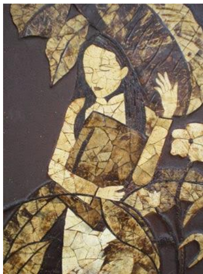
Bức tranh học trò

“Em tan trường về, đường mưa nho nhỏ Ôm nghiêng tập vở, tóc dài, tà áo vờn bay Em đi dịu dàng, bờ vai em nhỏ Chim non lè đường, nằm im dấu mỏ Anh theo Ngọc về gót giầy lạng lẽ đường quê...”