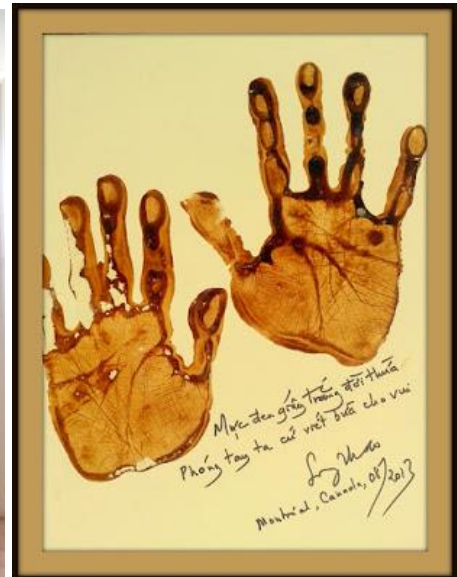
Dấu tay của Song Thao