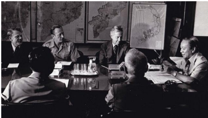
TT VNCH Nguyễn Văn Thiệu (bìa phải) trong một cuộc họp với Đại sứ Hoa Kỳ Graham Martin, người thứ nhì trong hình từ phải sang, đang nhìn vào ông.

Yếu tố thứ hai tạo ra căng thẳng lớn ngày hôm đó, là chúng tôi nhận được tin từ Hà Nội - một tín hiệu giả, rằng Bắc Việt sẵn sàng cho phép Tòa Đại sứ Hoa Kỳ ở lại Sài Gòn sau khi ngừng bắn. Điều đó có nghĩa là có vẻ như Bắc Việt sẽ không xóa sổ miền Nam VN, họ sẽ cho phép một chính phủ Nam VN được tồn tại ngay cả khi Bắc Việt chiếm xong được Sài Gòn. Và nếu chính phủ này tồn tại, thì Tòa Đại sứ Hoa Kỳ có thể tiếp tục hoạt động tại Sài Gòn. Vì vậy, giới lãnh đạo nuôi kỳ vọng vào sáng 25/4, là đơn giản chỉ cần ông Thiệu biến mất, thì một phép màu sẽ xảy ra.