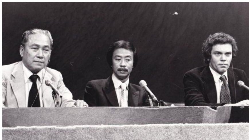
Phi trường Tân Sơn Nhất những ngày cuối cùng của VNCH Frank Snepp (bìa phải) và Tướng Nguyễn Cao Kỳ (giữa)