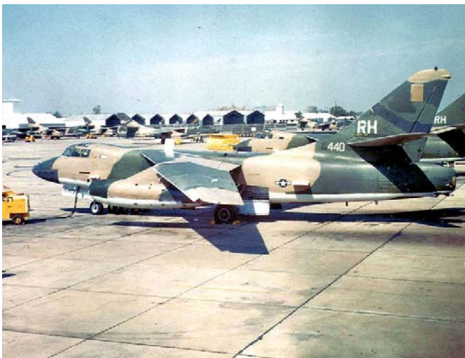
Phi cơ thám thính điện tử EB-66.