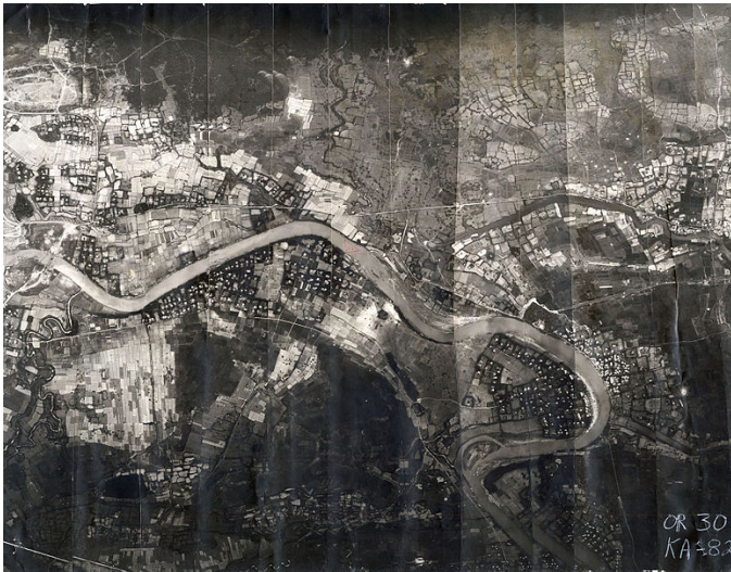
Phóng đồ hành quân Bat 21 Bravo và Nail 38 Bravo giải cứu Trung tá Không quân Hoa Kỳ Hambleton từ ngày 2 đến ngày 14 tháng 4 năm 1972.

Ngày 9 tháng 4, quân lực HK nhận thấy cuộc giải cứu kết hợp nỗ lực của nhiều binh chủng không thành công. 5 phi cơ bị bắn hạ, 9 quân nhân bị thiệt mạng, 2 người là tù binh, mất tung tích 2 sĩ quan khác. Không lực Hoa Kỳ gần như bó tay chưa biết tính toán như thế nào.