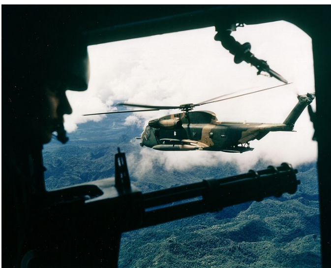
Trực thăng Jolly Green HH-53 cấp cứu phi công lâm nạn.