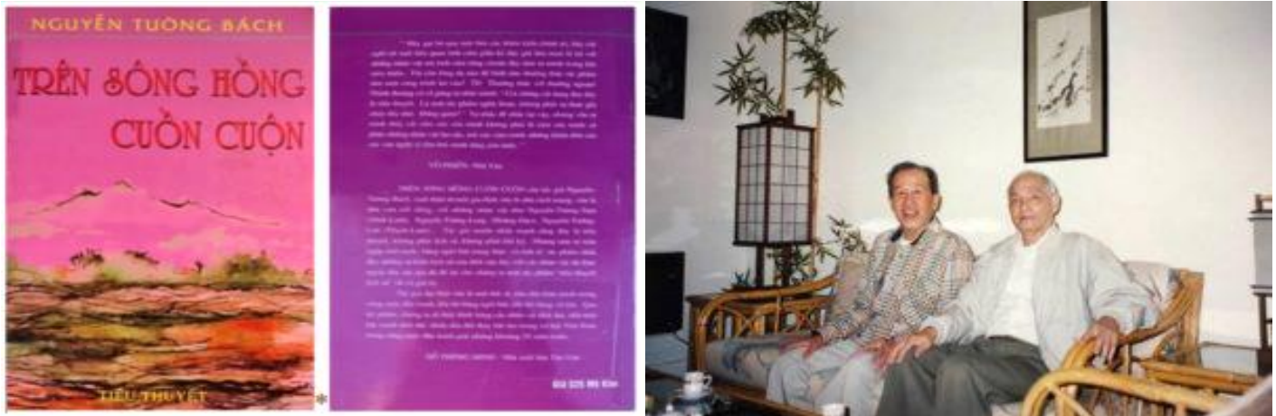
Hình 10b: Bìa cuốn trường thiên tiểu thuyết Trên Sông Hồng Cuồn Cuộn của Nguyễn Tường Bách, dày 655 trang. Bản thảo đã được viết sau khi về hưu, do Hứa Bảo Liên đánh máy và hoàn tất tại Phật Sơn, tỉnh Quảng Đông. Sách do Tân Văn – Đỗ Thông Minh xuất bản 1995.