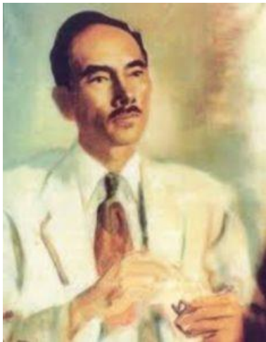
Hình 8: Chân dung Nhất Linh Nguyễn Tường Tam (1905* – 1963) của họa sĩ Nguyễn Gia Trí [*Năm sinh đúng của Nhất Linh là 1906, tức năm Bính Ngọ, nhưng khai sinh ghi 1905]

Nguyễn Tường Bách nói rõ hơn, và cho rằng cách chọn lựa của Nhất Linh là đáng tiếc và tiêu cực. Nhất Linh có thể đi ra một nước ngoài dễ dàng, như sang Cam Bốt, khi thời thế thay đổi Nhất Linh có thể trở về, anh Tam đang còn tiềm năng để cống hiến, nhất là về lãnh vực văn chương văn hoá. “Nghe nói trong đám tang anh rất lớn, dân chúng đổ ra đường để tiễn đưa một tinh anh của dân tộc. Nhưng đám tang dù lớn, dù đông tới đâu, cũng chẳng có ý nghĩa gì nữa, khi con người đã qua đời.” [6]