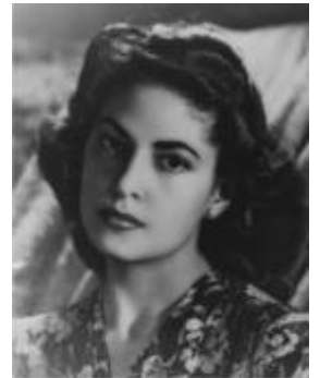
Consuelo Velázquez, tác giả “Besame Mucho”