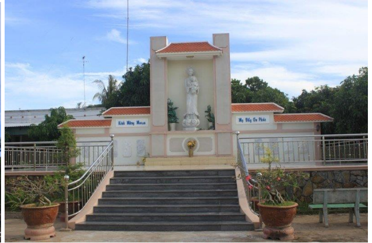
Đài Đức Mẹ Maria - Nhà thờ Bãi Chàm