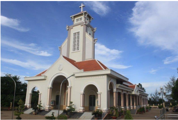
Nhà thờ Bãi Chàm

Tính đến nay, Nhà thờ Giáo xứ Bãi Chàm đã được 146 năm (1867-2013). Tuy nhiên, theo cơ cấu tổ chức của Giáo hội Công giáo như đã nêu trên, lúc đầu nơi đây chỉ là một Giáo điểm. Đến 20 năm sau, tức năm 1887, mới có người phụ trách là cha Greset và xây ngôi nhà thờ nhỏ, lợp ngói. Lúc này, Bãi Chàm đã trở thành Giáo họ, có khoảng 37 gia đình và ước chừng 250 giáo dân.