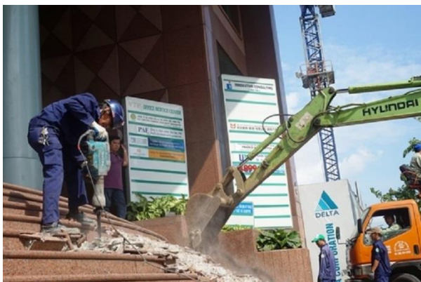
Ông “Hải cầu” cho đập bậc tam cấp trên đường Nguyễn Huệ hồi 2017

“Ở nhiều bài viết khác, bằng các biện pháp nghiệp vụ, mình đã phân tích rằng 99.99% quan lại phải tham nhũng, những ai không hoặc ít ăn tiền là do ở các vị trí không hay ít có “màu mè”. Nếu mình ở vị trí các anh thì mình cũng “ăn”, với cơ chế này thì ngu gì không ăn, không ăn thì sống bằng gì khi Tổng bí thư mới có lương cỡ 16 triệu/tháng? Thế mới nói 100% quan lại là củi dụn khuyết, chẳng qua chả ai đi câu mà tận diệt hết cả cá, chỉ bắt một số con liều lĩnh và số đen nhất thôi. Thế nhưng anh “Hải cầu” lại liều lĩnh khi ngang nhiên làm từ thiện tiền tỷ trong khi chỉ là một phó quận, lương tầm 7-8 triệu là tối đa. Tuy anh đã từ quan, nhưng ngay sau khi từ chức anh đã vung tiền làm từ thiện đến mấy tỷ, với lý do là bán đồng hồ và điện thoại do “một người thân tặng” giá 2 tỷ (!) Theo một bài báo khác, kể cả tiền đất lẫn xây nhà tình thương, anh phải bỏ ra tới 4.5 tỷ. Được biết anh Hải xuất thân từ chi cục thuế Quận 1, rồi leo lên phó quận. Mà ai cũng biết thuế là bộ phận ngon ăn nhất của mỗi địa phương, mà Quận 1 là quận giàu nhất SG. SG là thành phố giàu nhất cả nước. Quận 1 có lẽ thu thuế nhiều hơn một tỉnh nhà quê. Công bằng mà nói, hành vi từ thiện, dù đến từ bất cứ ai, thì đó cũng là hành vi tốt, đáng khen. Nhưng cái áo cà sa không tạo nên thầy tu. Người xấu hay tốt, tội phạm hay thiện lành, nó không hề quyết định bởi việc làm từ thiện.”