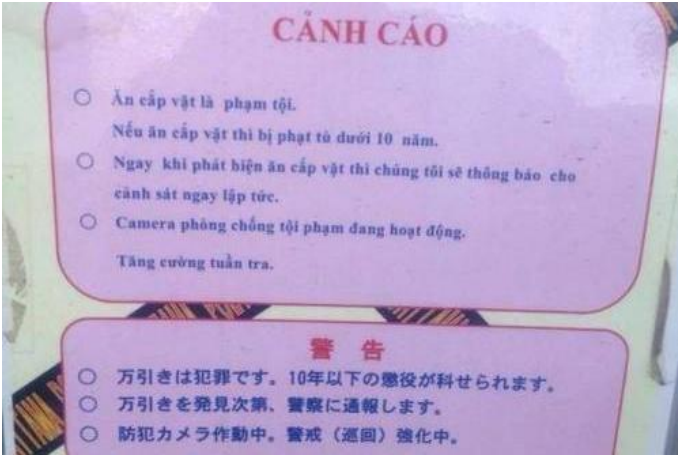
Biển cảnh báo tại một siêu thị ở Nhật Bản.

Một số người Việt ở nước ngoài có hành động xấu như trộm cắp, lấy thức ăn quá nhiều rồi bỏ... khiến hình ảnh Việt Nam đang dần trở nên xấu xí. Một số nước thậm chí đã trưng biển cảnh báo bằng tiếng Việt về tình trạng này.