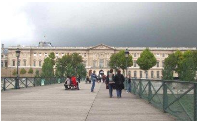
Passerelle des Arts

Cầu này là một cầu đi bộ dài 106 m nối liền Viện bảo tàng Louvre với Viện bảo tàng Orsay qua Jardin des Tuileries và sông Seine.