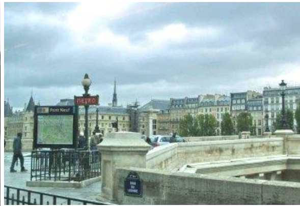
Cầu Mới (Pont Neuf)

Vào giữa thế kỷ 16, sông Seine chỉ có hai cây cầu bắc ngang nối liền hai bờ thành phố Paris nên cầu luôn luôn bị hư hại vì quá đông. Năm 1578 vua Henry III quyết định xây một cây cầu mới, và dự án thật sự bắt đầu vào năm 1607. Cầu được hoàn thành và vua Henry IV đặt tên cầu là pont Neuf. Sau khi vua Henry IV qua đời, một tượng vua Henry IV cưỡi ngựa được đặt ở công trường Pont Neuf. Tượng hiện tại là tượng sao chép lại tượng nguyên thủy đã bị đốt cháy trong cuộc Cách mạng Pháp, tượng sau này được làm lại vào năm 1818.