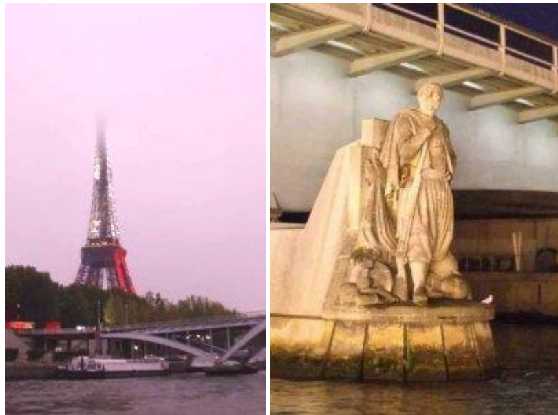
Cầu Alma và Zouave tại cầu Alma

Cầu mang tên trận chiến Alma, một trận chiến Pháp đánh bại Đức. Đó là trận chiến đầu tiên có lính Zouave (lính bộ binh Algérie) tham dự. Vì thế nên có tượng một người lính Zouave đặt ở gần cầu. Tượng lính Zouave này được dùng để đo lường mực nước của sông dâng lên. Nước dâng cao nhất trong lịch sử Paris là năm 1910. Cầu mực nước lên đến vai Zouave.