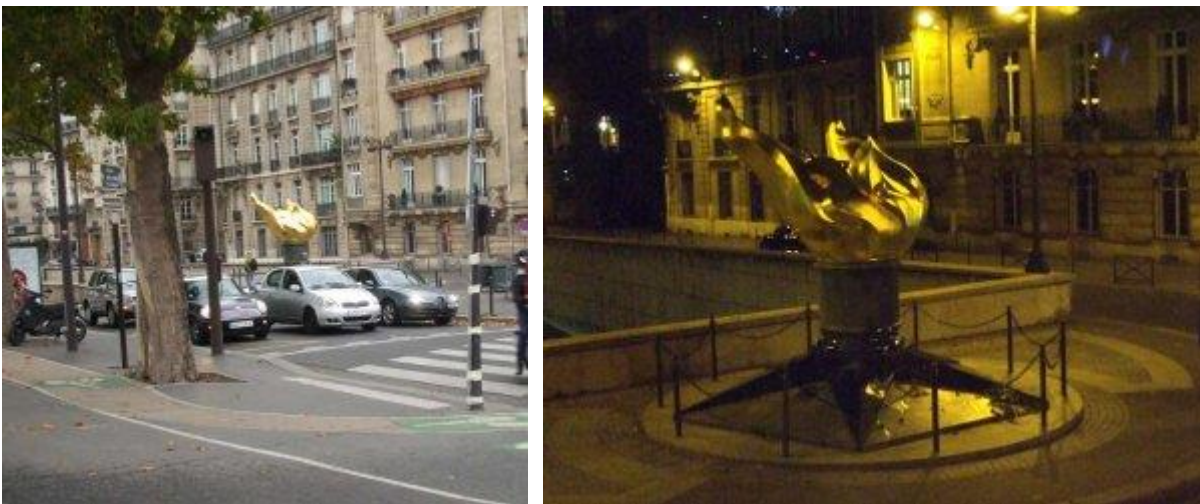
Ngọn lửa Tự-do ở công trường Alma

Nơi này sau đó đã được bao quanh với dây xích để ngăn cản sự biến đổi nơi này thành đài tưởng niệm khác với ý nghĩa nguyên thủy.