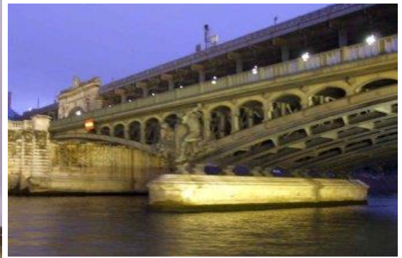
Cầu hai tầng Bir-Hakeim