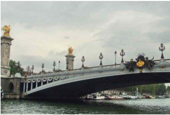
Cầu Alexander III