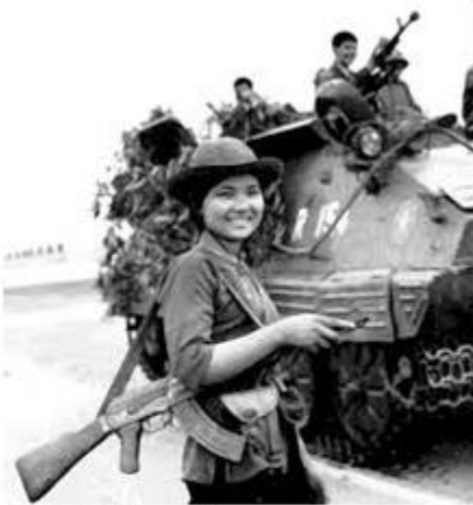
Cô Nhíp ngày xưa.