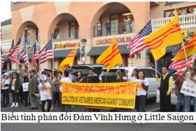
Biểu tình phản đối Đàm Vĩnh Hưng ở Little Saigon