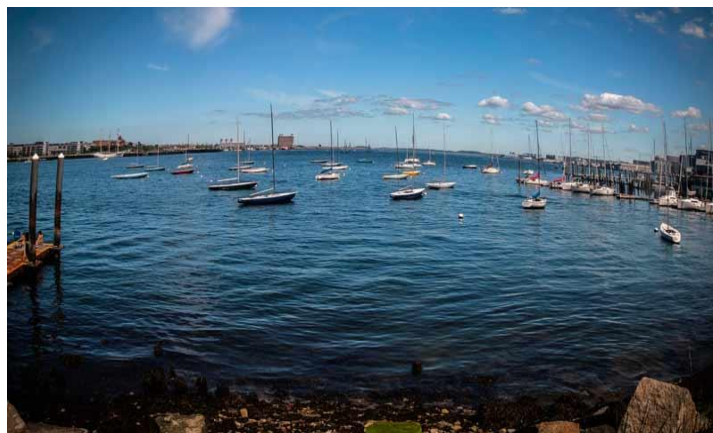
Biển Phố Ý.