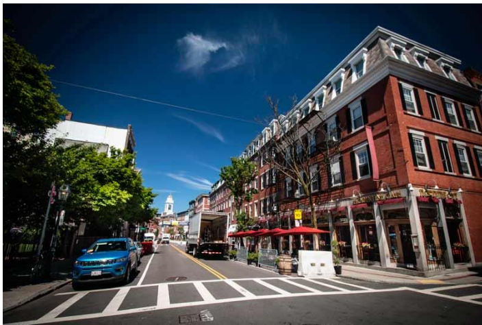
Đường chính, Hanover.