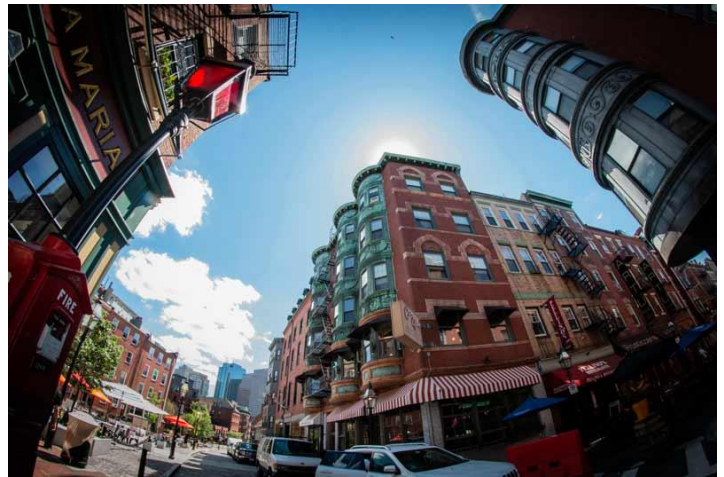
Khu nhà hàng.

Tôi gọi 24 con sò ướp lạnh, 2 lít bia Duvel.