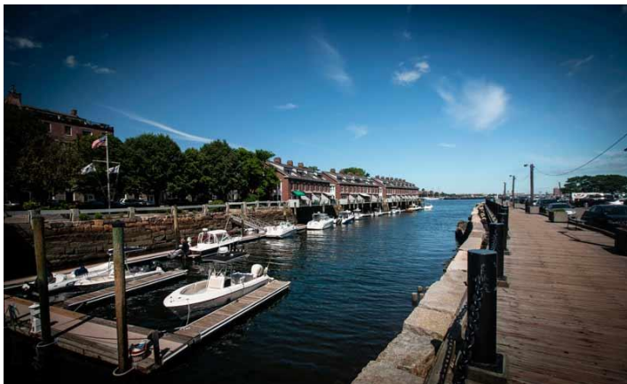
Đường đi bộ vô Phố Ý.