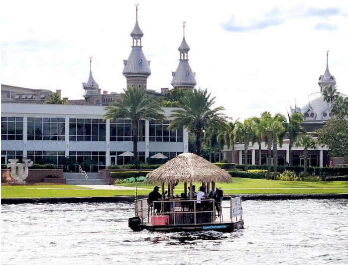
Quán bar là thuyền trên sông -- Một cuộc tuần hành của cộng đồng Iran ủng hộ người dân trong nước

Còn nhìn nhận theo góc cạnh lịch sử thì cho đến thế kỷ thứ 19, người dân Cuba vẫn qua lại bình thường với Florida, phần lớn là tìm kiếm công việc. Họ mang theo một văn hóa cùng nền ẩm thực Cuba sang các thành phố Florida nên đến bây giờ thì người Cuba cư ngụ tại Miami, Tampa hay Florida nói chung khá đông. Họ là sắc dân thông minh và dễ mến bởi Cuba được mệnh danh là “Do Thái của Mỹ La Tinh” mà.