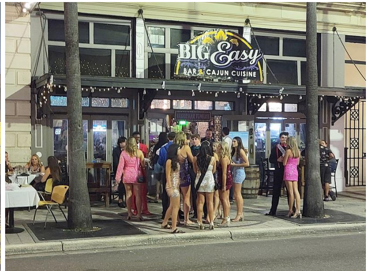
Giới trẻ tại phố cổ Ybor

Với tôi, Tampa đẹp và yên bình. Khu vực Riverwalk ngay trung tâm thành phố Tampa là nơi tập trung khá nhiều khách sạn, nhà hàng, bảo tàng cùng nhiều hoạt động giải trí cho những ai muốn ghé chơi Tampa một cuối tuần nào đó và chưa biết sẽ chọn mướn khách sạn ở đâu. Cách phi trường chỉ 15 phút lái xe, từ khu trung tâm này nếu rảo bộ hay sử dụng các phương tiện giao thông công cộng, taxi nước hay xe taxi đều thuận tiện, dễ dàng và giá mỗi cuộc xe cũng rất thấp nếu gọi Uber hay Lyft. Ra biển ngay Tampa cũng gần và có muốn ra đến biển Clearwater thì cũng chỉ hơn nửa tiếng chạy xe. Tampa có một kiến trúc và cảnh quan đa dạng nhưng khu vực trung tâm này và dọc theo sông Hillsborough là những cao ốc tân thời, hoặc là khách sạn và văn phòng của các tập đoàn tài chính, bảo hiểm hay là chung cư cao tầng sang trọng. Nếu bạn mướn khách sạn tại khu vực này thì ra cảng du thuyền hay xem thể thao, ca nhạc cũng có thể đi bộ. Có con nhỏ muốn dẫn vào các bảo tàng hay công viên thủy sinh đều là các khu lân cận. Chẳng dự định làm gì thì vào các quán bên sông hay đón taxi sông chạy dọc theo bờ ngắm cảnh cũng là điều nhẹ nhàng, thú vị.