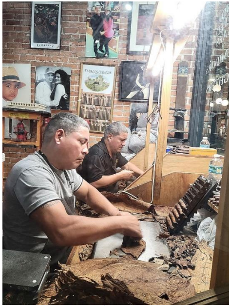
Thợ Cuba quấn xì gà