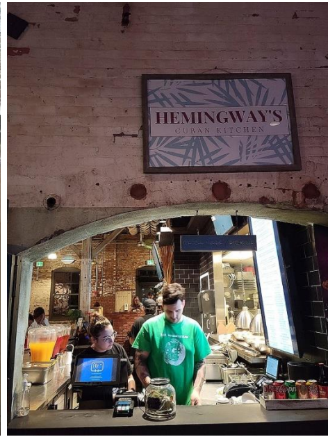
Một tiệm ăn Cuba

Còn nhìn nhận theo góc cạnh lịch sử thì cho đến thế kỷ thứ 19, người dân Cuba vẫn qua lại bình thường với Florida, phần lớn là tìm kiếm công việc. Họ mang theo một văn hóa cùng nền ẩm thực Cuba sang các thành phố Florida nên đến bây giờ thì người Cuba cư ngụ tại Miami, Tampa hay Florida nói chung khá đông. Họ là sắc dân thông minh và dễ mến bởi Cuba được mệnh danh là “Do Thái của Mỹ La Tinh” mà.