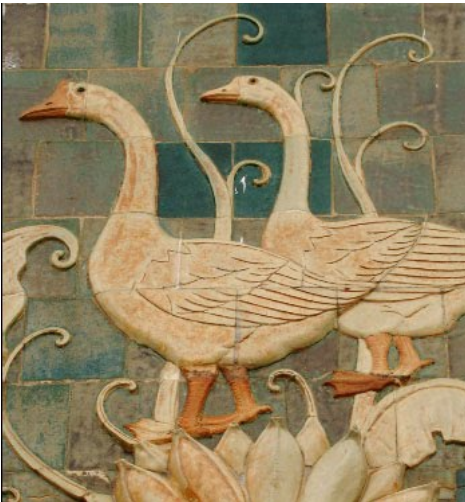
Phù điêu hình vịt (cửa Bắc)

Những thuận lợi ban đầu, khi ở Sài Gòn họ tạo điều kiện cho mình, nhưng bên cạnh đó gặp cũng không ít khó khăn. Ở cái cửa chính kế ga xe lửa, chỗ này về khuya cá biển về họ mần rầm rầm hơi nó bốc lên mà nó hôi tanh, muốn ói vậy, trong khi đó mình phải ngủ trên... những chiếc đồng hồ nơi cửa chính này. Ban ngày thì nắng chang chang, sáng có sương mù tối đến mưa phùn, những giấc ngủ lạnh buốt là thế nhưng những người nghệ nhân Biên Hòa này luôn cố gắng để hoàn thành công việc được giao. Theo trí nhớ của hai nghệ nhân gồm, thì thời gian hoàn thành 12 bức phù điêu cho bốn cửa của chợ Bến Thành khoảng hai tháng trở lại chứ không có hơn, cũng mau lắm!