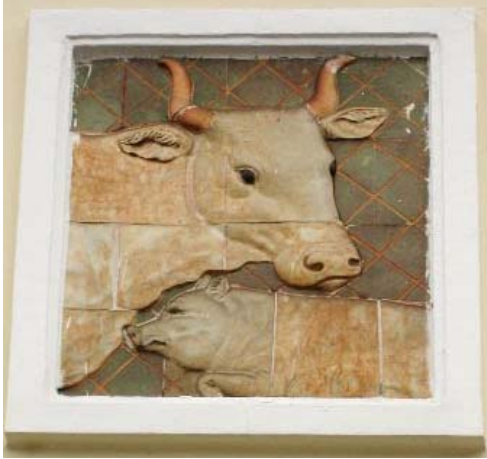
Phù điêu hình bò và heo (cửa Đông)

Tôi đọc được một trang nhật ký của một nghệ nhân mỹ nghệ Biên Hòa ghi: “Ngày 1.9 (âm lịch) mưa cả ngày. Qua ngày 2.9 nước lên lẹ cấp kỳ. Nước xuống lần cho tới ngày 17.9. Đâu về đó”. Đó là những dòng chữ ghi lại nhật ký trận lũ lịch sử Nhâm Thìn (1952) tại Biên Hòa.