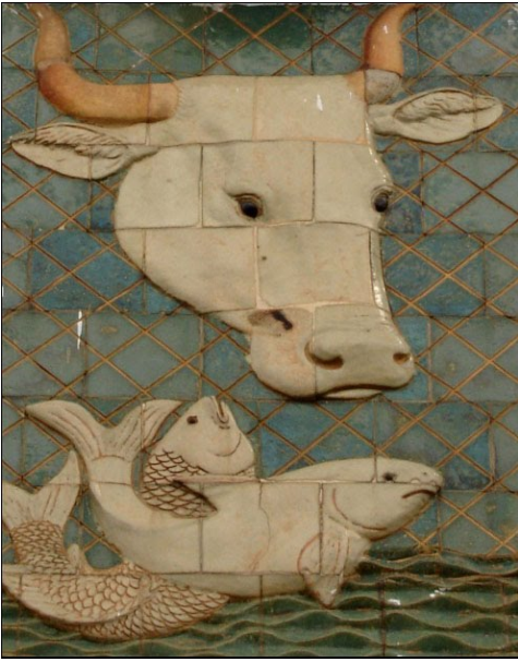
Phù điêu hình bò và cá (cửa Nam)

việc đang đợi mình ở Biên Hòa, nên ông Ba Ngà về trước, để lại những tấm phù điêu đó cho hai người thợ trẻ tiếp tục công việc.