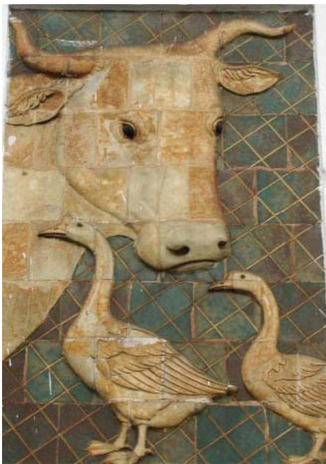
Phù điêu hình bò và vịt (cửa Đông)

Tôi đọc được một trang nhật ký của một nghệ nhân mỹ nghệ Biên Hòa ghi: “Ngày 1.9 (âm lịch) mưa cả ngày. Qua ngày 2.9 nước lên lẹ cấp kỳ. Nước xuống lần cho tới ngày 17.9. Đâu về đó”. Đó là những dòng chữ ghi lại nhật ký trận lũ lịch sử Nhâm Thìn (1952) tại Biên Hòa.