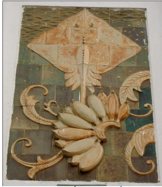
Phù điêu hình cá đuối và nãi chuối (cửa Tây)

Những thuận lợi ban đầu, khi ở Sài Gòn họ tạo điều kiện cho mình, nhưng bên cạnh đó gặp cũng không ít khó khăn. Ở cái cửa chính kế ga xe lửa, chỗ này về khuya cá biển về họ mần rầm rầm hơi nó bốc lên mà nó hôi tanh, muốn ói vậy, trong khi đó mình phải ngủ trên... những chiếc đồng hồ nơi cửa chính này. Ban ngày thì nắng chang chang, sáng có sương mù tối đến mưa phùn, những giấc ngủ lạnh buốt là thế nhưng những người nghệ nhân Biên Hòa này luôn cố gắng để hoàn thành công việc được giao. Theo trí nhớ của hai nghệ nhân gồm, thì thời gian hoàn thành 12 bức phù điêu cho bốn cửa của chợ Bến Thành khoảng hai tháng trở lại chứ không có hơn, cũng mau lắm!