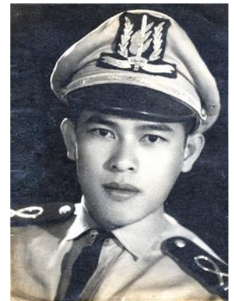
Cha của tác giả khi còn là SVSQ tại trường Sĩ Quan Thủ Đức

Xe lửa từ từ chuyển bánh. Ngồi bên cạnh cửa sổ, tôi có dịp ngắm nhìn thành phố vào đêm và tôi có dịp cảm giác những làn gió mát thổi vào mặt. Trong đầu tôi miên man với nhiều suy nghĩ, đó là sẽ được gặp lại ba tôi và sẽ được nhìn thấy những điều mới lạ trong đời. Đêm đã khuya, mẹ tôi phủ lên sàn tàu bên dưới băng ghế một lớp nylon và bảo tôi nằm ngủ trên đó. Nằm sát sàn tàu, tôi nghe văng vẳng tiếng kêu nhíp xinh xịch, tiếng ma sát của bánh xe với đường rây kêu ken két, hòa lẫn tiếng còi hụ như hòa nhíp đưa tôi vào giấc ngủ từ lúc nào.