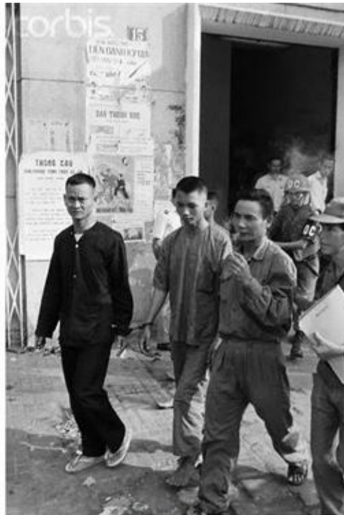
Hồi chánh viên Tám Hà

Đợt tấn công Tết Mậu Thân Việt Cộng bị thất bại nặng nề nhưng bọn cầm đầu lại cho là “Thắng lợi to lớn hơn bao giờ hết.” Trên thực tế, thì về quân sự chúng không đánh chiếm và kiểm soát được một mục tiêu hoặc một vùng nào đáng kể. Về chính trị, cũng