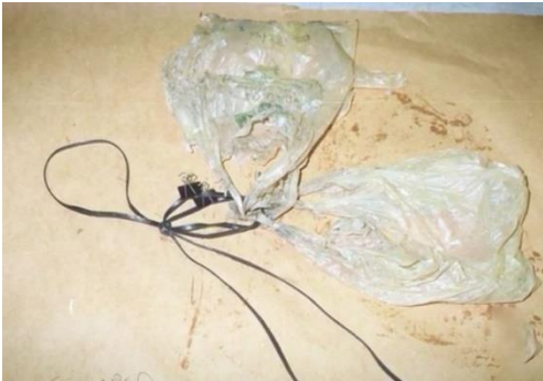
Hai chiếc túi nylon hung thủ dùng chứa đá nặng.