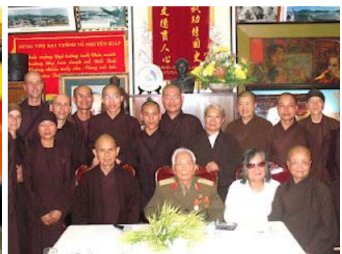
Thăm anh 5 Condom Võ Nguyên Giáp