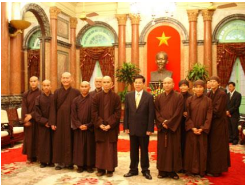
Hí hửng với VC Nguyễn Minh Triết

Nhưng đau buồn thay, Thiền sư Nhất Hạnh là một tu sĩ Phật giáo mà không làm được chuyện đó! Ngược lại, Thiền sư đã vọng ngữ, bóp méo lịch sử, đưa ra những dữ kiện sai lạc nhằm vu cáo quân lực chính nghĩa Cộng hòa, làm lợi cho Cộng sản, trong lúc mà phong trào tranh đấu cho nhân quyền và tự do tôn giáo đang lên cao. Thiết nghĩ, việc làm của Thiền sư Nhất Hạnh cần phải được chỉnh đốn.