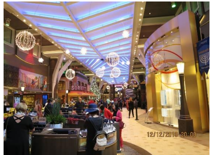
Đường Royal Promenade tầng 5

Central Park tầng 8 khác biệt hẳn tàu Royal Caribbean so với những tàu lớn hãng khác. Nơi đây vườn hoa kiểng với hơn 10.000 cỏ hoa nhiệt đới lớn nhỏ, có lan, có trúc (tài liệu khác ghi 20.000 cây cỏ ?). Nay đang mùa Giáng sinh nên hoa trạng nguyên (poinsettia) đỏ rực bày biện đồ đầy dọc theo lối đi hoặc rải rác trong vườn rất đẹp. Trong Central Park các lối đi lát gạch đá sạch sẽ. Các băng gỗ hay băng sắt sơn đỏ đặt trong vườn dọc theo lối đi hay dưới các cổng hình vòng cung để khách ngồi nghỉ chân, nghe nhạc, thưởng thức gió mát hay tâm sự với bạn bè.