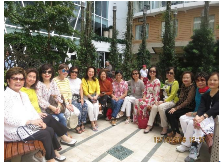
Central Park. Tầng 8