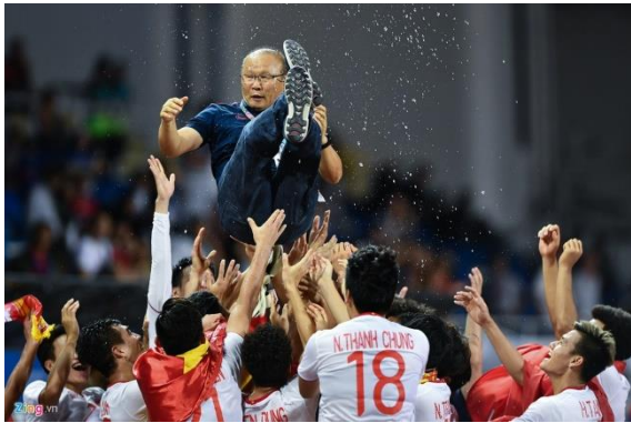
Các cầu thủ VN công kênh HLV Park Hang-seo

Trước màn kiếng ti vi bóng láng, người ta không còn tìm thấy được mọi hình ảnh xe cộ lưu thông quen thuộc giống như hằng ngày. Và được thay vào đó, là cái cảnh giao thông tắc nghẽn vì bị con số người cực kỳ đông nghẹt đồng lúc kéo nhau túa ra đường tưng bừng vui vẻ ăn mừng đội tuyển nam U22 Việt-Nam vừa oanh liệt đoạt giải chung kết bóng đá SEA Games 30. Fans ham mộ nghệ thuật nhồi bóng chính hiệu gồm cả mọi thành phần thế hệ già trẻ bé lớn, họ chạy đủ loại xe ra khắp các nẻo đường phát cờ, đeo băng rôn, mang loa reo hét, và dập dồn vang to khẩu hiệu " Việt-Nam vô địch " qua những lượn sóng âm thanh liên tục kéo dài. Trận đấu sôi nổi này diễn ra ở tại sân vận động Rizal Memorial (Philippines) và đã được trực tiếp truyền hình khắp nơi trên thế giới. Dưới sự dìu dắt của HLV Park Hang-seo, kết thúc trận đấu đem thắng lợi về cho đội tuyển VN tám huy chương vàng lần đầu tiên sau 60 năm chờ đợi*.