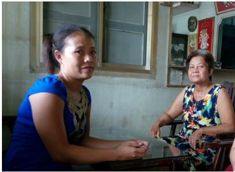
Chủ nhân tấm vé số Vietlott trúng 92 tỉ đồng (người mặc áo xanh)**

đảm để minh họa, cố võ cho lòng can đảm, cương quyết đầy nghị lực của mình. Hình ảnh của Chú Bảy Chà, Chú Ba Tàu đến phương đất lạ trời xa với đôi bàn tay trắng gầy dựng nên sự nghiệp lớn lao, biết rằng đó chỉ là những trường hợp ngoại lệ hiếm hoi. Nhưng tấm gương của những nhà tỉ phú đó đây đã thành công tạo dựng được cơ đồ, hoặc may mắn tốt phúc được trời cho sự nghiệp trong khi tuổi đời của họ còn trẻ trung, thì đối với tất cả mọi người có phải đó là một bài học vô cùng sáng giá? Và tôi tự nghĩ mình phải có mua vé số, thì mới hy vọng có ngày được trúng số như một trường hợp hy hữu đã từng xảy ra trong lịch sử xổ số ở VN từ xưa cho tới nay**. Tấm vé số là thời thế sẽ tạo ra những đại phú gia và giúp họ được hanh thông sự nghiệp tiến thân. Nhưng muốn mua tấm vé số, trước hết phải có tiền. Tiền bạc là huyết mạch của sự sống, không có nó thì mọi việc sẽ khó được xuôi sẽ.