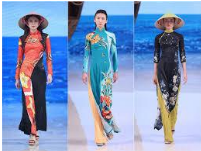
Ảnh ngày tổ chức

- Nhưng bây giờ mới có điều làm cho nội buồn nhất, vì nó không phải là chuyện kỳ thị kỳ duyên gì hết mà nó là chuyện đánh lộn con đen. Cháu biết không, mới đây ở bên Tàu có tổ chức rầm rộ tuần lễ Thời-Trang hè 2020 được hầu hết các báo chí trong xứ giật tít đăm "Phong-Cách Trung-Quốc làm tỏa sáng thời trang Trung-Quốc". Thế nhưng, không hiểu sao Ban-Tổ-Chức lại phải ra công ăn cấp công khai kiểu y phục áo dài truyền thống của người phụ nữ Việt-Nam rồi đem ra trình diễn làm cho công chúng hoài nghi!