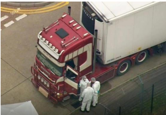
Xe đông lạnh chở 39 người VN xấu số vượt biên trái phép ở Anh

Trong hiện tại, cuộc sống của tôi quá được tự do, mà tự do trong nỗi dằn vặt của tâm hồn, vì trí óc của tôi thì luôn luôn không cho phép mình có thể vượt qua được tình thân gia phong và nghĩa tình đạo lý. Do vậy, tôi phải sống sao cho xứng đáng với tình thương yêu của những người thiện tâm đã từng cứu mạng, đùm bọc chở che tôi từ bấy năm qua. Tôi sẽ sống với nội cho tới ngày nội không còn nữa. Tuổi hạc của người nay đã quá cao, đâu có làm gì ra tiền để mà lo cho tôi được đầy đủ. Ngược lại, tôi biết chính nội cũng không cần đòi hỏi gì vào sự giúp đỡ về vật chất tiền bạc của tôi. Duy có điều mà nội không nói ra nhưng tôi biết, đó là lòng hiếu thảo của con cháu đối với ông bà. Chính vì thế mà ngày nào thấy nội vui cười mãn nguyện, thì ngày đó, tôi kể như mình đã âm thầm vinh quang thành đạt được một tấm huy chương. Và bây giờ, tôi hết sức vui mừng khi vừa tìm thấy được con đường đèn ơn đáp nghĩa của mình từ nay mở rộng.