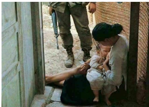
Trước khi bị áp giải, người phụ nữ yêu cầu xin được cho con bú (Minh họa)

Tôi rất sung sướng được làm con của ba mẹ và là cháu của nội. Tôi kính trọng bà nội bao nhiêu thì tôi cũng vô cùng thương nhớ ông nội bấy nhiêu. Chính ông nội chớ không phải ba tôi là người đầu tiên đã dạy cho tôi biết đọc chữ, và thường hay để dành bánh trái mang về cho tôi mỗi khi đi đám giỗ. Thế mà đã có một lần, tôi đại khờ nói nội ăn nhiều nên bị mẹ rầy nói con phải đi xin lỗi nội. Tuy nhiên, sự khờ dại vô tình này đã dạy cho tôi một bài học kinh nghiệm lý thú đối với bản tính của trẻ con. Vì tự nhiên vô tình thấy trái đào ở cổ nội chạy lên, chạy xuống trong khi ăn uống, cho nên ý tôi chỉ muốn nói nội đang ăn thôi. Dù sao, cũng nhờ đó mà tôi bắt đầu biết phân biệt dứt khoát về giới tính, và khi gặp ai thì tôi thường thích dòm ngay vào cổ họng của họ thay vì nhìn vào sự trang điểm, y phục.