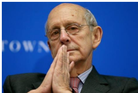
Thẩm phán Stephen G. Breyer

Tối Cao Pháp Viện sẽ nghe vụ Mississippi vào tháng 12, và có thể đưa ra phán quyết trong tháng 5 hay tháng 6 năm sau, đúng vào lúc các cuộc tranh cử giữa nhiệm kỳ năm 2022 cũng đang tới hồi sôi động. Nhưng, ngoài chuyện phá thai, những người săn tin Tối Cao Pháp Viện cũng đang chú ý tới việc phe Dân Chủ và cánh tự do khuynh tả (liberal) đang gây sức ép buộc Thẩm phán TCPV Stephen G. Breyer về hưu để Tổng thống Biden có cơ hội tiến cử một người khác trẻ hơn ngồi vào chiếc ghế của