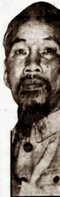
HO CHI MINH

President Ho arrived back in Jakarta today from Bali. He will leave tomorrow for Medan, Sumatra, where he will stay overnight en route to Hanoi.—U.P.I.