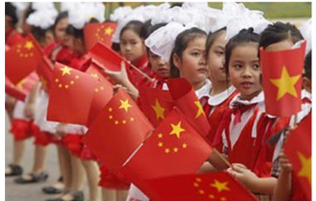
Trẻ em VN đón Tập Cận Bình với cờ TQ có sáu ngôi sao

3-Vào ngày 18/06/2014, Ủy Viên Quốc Vụ Viện TQ Dương Khiết Trì đã tới Hà Nội để trao đổi với Bộ Trưởng Ngoại Giao Việt Nam, Phạm Bình Minh, về vụ tranh chấp lãnh hải giữa VN và TQ. Khi Dương Khiết Trì về tới TQ, tờ Hoàn Cầu Thời Báo đã đưa tin rằng trong cuộc gặp gỡ với ngoại trưởng Phạm Bình Minh, Dương Khiết Trì đã cho VN một cơ hội để tự kiểm chế, trước khi đã quá trễ và thúc giục đưa con hoang trở về với gia đình, Lời nói này của Dương Khiết Trì chẳng những có tính chất khinh thường các vị lãnh đạo cao cấp của đảng CSVN mà còn có ý nhục mạ thậm tệ các vị này nữa, song họ vẫn ngậm miệng mà không có bất kỳ một phản ứng tương xứng nào cả, vì thế người ta tin rằng họ đã biết rõ là các vị tiền nhiệm của họ đã cam kết với đảng CSTQ là sẽ làm hết sức mình để CHXHCNVN mau chóng trở thành vùng tự trị của CHNDTH, nên họ không thể há miệng vì sợ mắc quai.