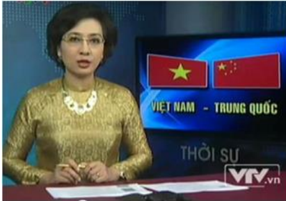
Đài Truyền Hình Việt Nam, ngày 14/10/2014

Mãn-Mông-Hồi-Tạng. Như vậy ngôi sao nhỏ thứ 5 mà CSVN thêm vào lá quốc kỳ của TQ tượng trưng cho dân tộc nào đây? Phải chăng đó là dân tộc Việt?