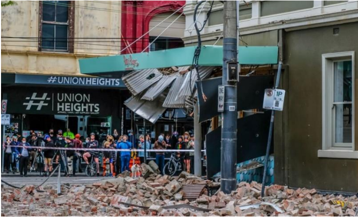
Cuộc biểu tình cuối cùng phải chấm dứt vì trận động đất 5,9 độ.

Chính quyền tiểu bang Victoria dự kiến mở cửa các địa điểm vui chơi giải trí vào ngày 8/11, với điều kiện người dân giữ khoảng cách. Song ông Wheatley không có nhiều hy vọng vì mọi người đều giữ tâm lý e ngại, phòng thủ trước dịch bệnh. Đây là sự bất ổn lớn vào lúc này. Chúng tôi không biết thành phố sẽ hành động như thế nào, khi mà Covid-19 luôn tồn tại , ông nói.