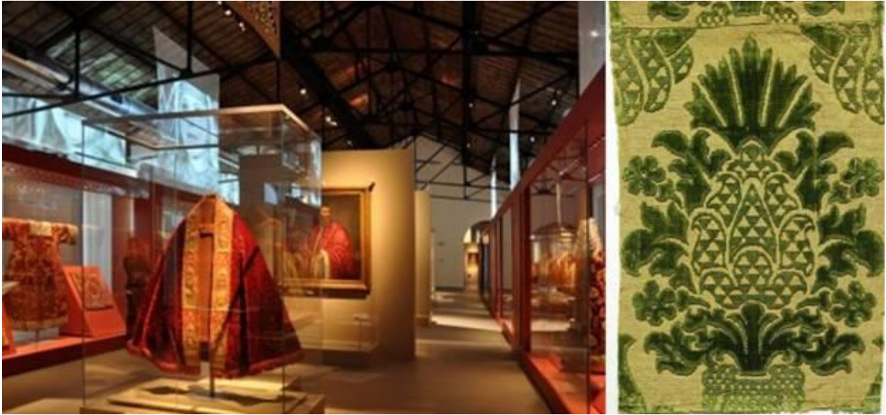
Bảo Tàng Prato

Thành phố Milan cách thủ đô Rome 573 km, Prato ở chính giữa với 195,000 cư dân. Kỹ nghệ dệt Prato 800 năm nổi tiếng không chỉ châu Âu mà khắp thế giới, có Museo del Tessuto/Bảo Tàng Vải Sợi.