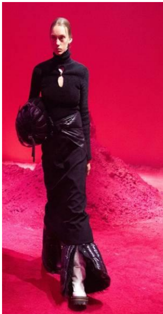
Sàn thời trang Milan 2/2020

Mỗi năm, người ưa diện hào hức hướng tới "kinh đô thời trang Milan" vùng Lombardy bắc Ý. Người mẫu hốc hác như ốm đối bước chân mèo cat-walk quần áo đôi khi quái dị.