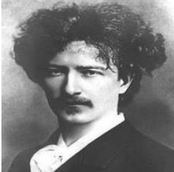
Ignacy J Paderewski

Đây là một câu chuyện có thật xảy ra vào năm 1892 tại Đại Học Stanford: Có một anh sinh viên 18 tuổi đang gặp khó khăn trong việc trả tiền học. Cậu ta là một đứa trẻ mồ côi, và cậu ta không biết đi nơi đâu để kiếm ra tiền. Thế là anh chàng này bèn nảy ra một sáng kiến. Cậu ta cùng một người bạn khác quyết định tổ chức một buổi nhạc hội ngay trong khuôn viên trường để gây quỹ cho việc học. Họ tìm đến người nghệ sĩ dương cầm đại tài Ignacy J Paderewski. Quản lý của Paderewski đòi một $2000 để được ông ấy biểu diễn. Thỏa thuận xong, hai sinh viên bắt tay ngay vào công việc chuẩn bị buổi trình diễn sao cho thành công.