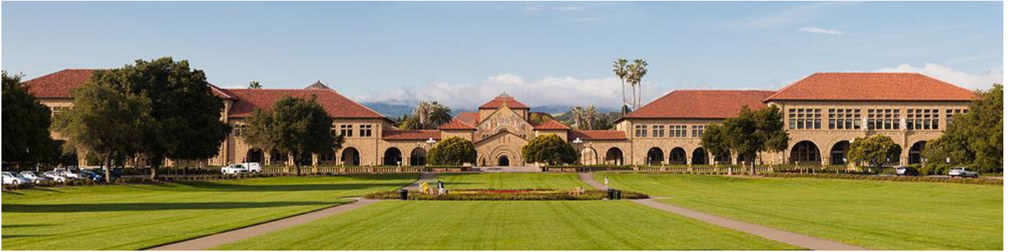
Stanford University, 1892