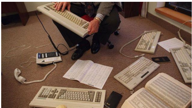
Máy tính, máy fax từng là mặt hàng được người Việt đem từ Ba Lan sang Liên Xô trong những năm đầu thập niên 1990 (minh họa)

Một thế hệ triệu phú người Việt ở Đông Âu dần được hình thành. Kể từ đó, nhiều người sau khi đã rất thành công về mặt kinh tế ở nước ngoài đã quay trở về đầu tư vào nhiều dự án đình đám ở Việt trong các lĩnh vực bất động sản, tài chính, ngân hàng.