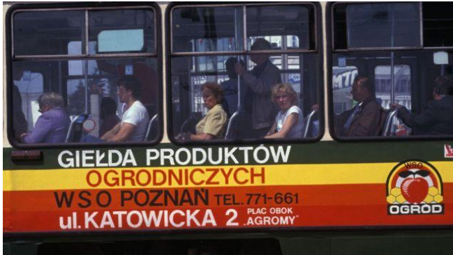
Hình quảng cáo cho chợ bán buôn rau quả trên tàu điện ở Poznan, Ba Lan năm 1989, khi Ba Lan chuyển từ kinh tế kế hoạch hóa sang thị trường tư bản sơ khai

Mạng lưới quan hệ của người Việt tại các quốc gia này còn gồm cả công nhân xuất khẩu lao động sang Liên Xô, Tiệp Khắc, Đông Đức, Bulgaria (không có Ba Lan).