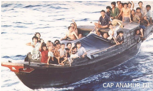
CAP ANAMUR III

Kỷ niệm ngày Hội ngộ 30 năm cộng đồng người Việt ở Bodensee. Cảm tạ nhân dân cùng chính phủ Đức, Áo và Thụy Sĩ đã cứu mang chúng ta!