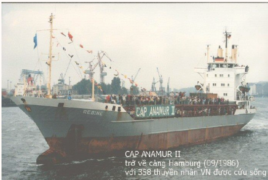
CAP ANAMUR II trở về cảng Hamburg (09/1986) với 358 thuyền nhân VN được cứu sống

Chị hoảng hốt khi chợt nhìn thiếu phụ Bồng con thơ toan nhảy xuống biển sâu Vì không chịu nổi bàn tay khát máu Của một loài như hải quỳ đầu trâu