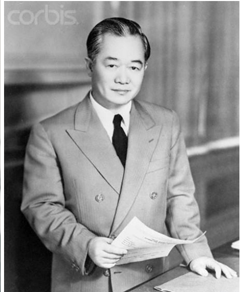
Ông Trần Văn Chương – thân phụ bà Trần Lệ Xuân (bà Nhu), Đại sứ Nam VN tại Hoa Kỳ, 1-5-1956.