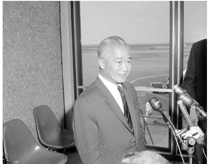
TT Eisenhower và phu nhân (giữa) đến thăm TT Diệm tại tòa ĐS Việt Nam. Ngoài cùng hai bên là ông bà Trần Văn Chương, đại sứ VN tại Hoa Kỳ. - Ông Trần Văn Chương tại Hoa Kỳ – Chicago, Oct 23 1963