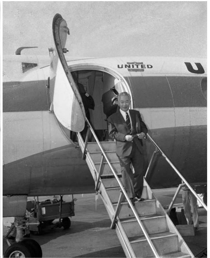
Ông Trần Văn Chương trong chuyến công du O'Hare Field , Chicago, Oct 23 1963.- Ông Trần Văn Chương, thân phụ bà Ngô Đình Nhu, cựu Đại sứ VNCH tại Hoa Kỳ, đang bước xuống máy bay tại phi trường O'Hare Field ngày 23-10-1963.