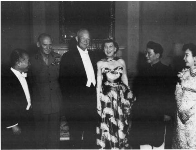
Visit of President Ngô Đình Diệm of Viet Nam. Viet Nam Embassy. May 10, 1957. 75-AR-1163-F