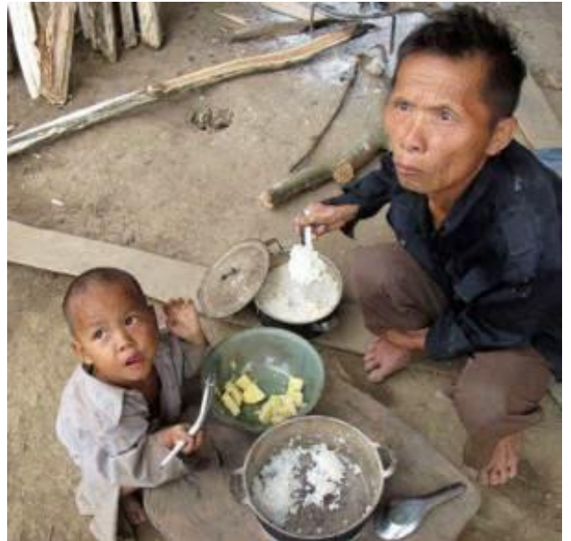
Bữa ăn của nông dân sau cải cách và hiện nay