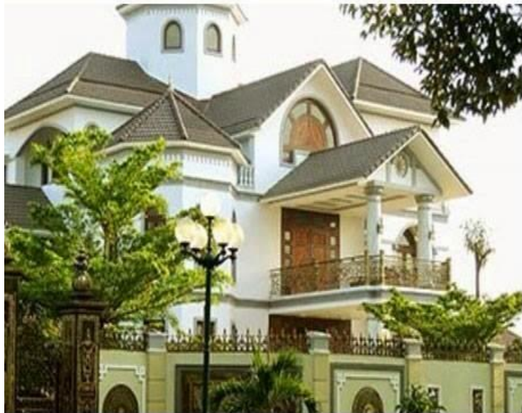
Nhà đầy tớ