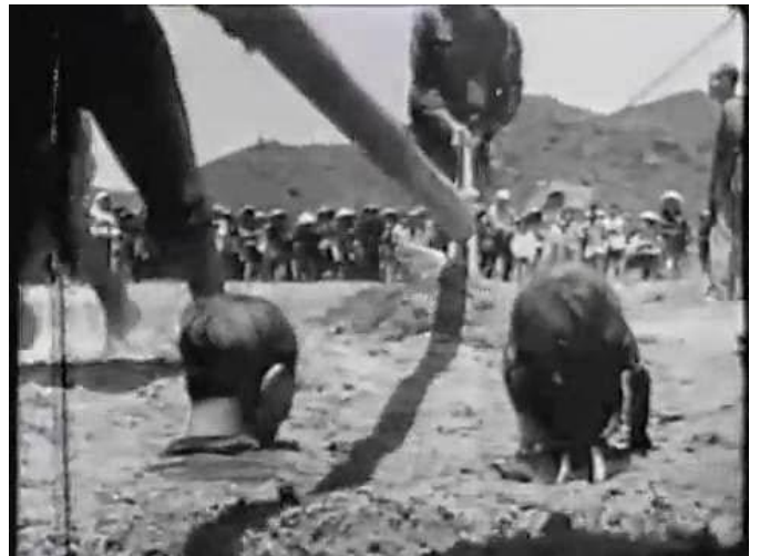
Đấu tố, xử tử địa chủ ở Miền Bắc

Có người phát hiện ra có những hình ảnh trưng bày được diễn hoặc đóng lại. Nhiều người tinh quái, tìm ngay ra những hình ảnh tương phản để vô hiệu việc tuyên truyền trong phòng trưng bày. Họ đặt bữa cơm của nông dân hồi ấy cạnh bữa ăn của nông dân hiện nay để cho thấy sáu chục năm qua, đời sống của nông dân hóa ra là... thụt lùi. Trưng bày về ngôi nhà lụp xụp của nông dân so với nhà địa chủ thì họ đưa ra hình ảnh nhà nông dân VN bây giờ cũng lụp xụp không kém và nhà quan chức thì nguy nga tráng lệ gấp nghìn lần nhà địa chủ ngày xưa. Những cảnh đấu tố, bắn giết được đưa lên cùng con số hàng trăm nghìn người bị tố oan, hàng vạn người bị giết để minh chứng cho sự "thành công" của CCRĐ. Nói về thành quả chia ruộng đất cho bản cổ nông, thì bị phỏng vấn những câu hóc hiểm, như "ông nghĩ gì về việc ruộng đất hiện nay lại tập trung vào tay quan chức nhà nước và đảng cộng sản", khiến cho người được phỏng vấn chỉ còn cách lảng.