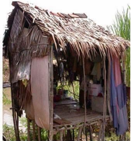
Nhà ông chủ

Tại hại hơn, nhiều người còn đem cải cách điền địa ở Miền Nam ra so sánh để cho rằng, cải cách điền địa ở miền Nam vẫn là mục tiêu người cày có ruộng nhưng không có cảnh tước đoạt, bắn giết. Nhà nước mua ruộng của địa chủ chia cho nông dân. " Nhiều quan sát viên quốc tế đã cho chương trình "Người Cày Có Ruộng" là một trong những chương trình cải cách điền địa thành công nhất ở các nước hậu tiến. Nó là điểm vàng son của nền Đệ nhị Cộng hòa". Chương trình này đã tạo ra một tầng lớp tiểu nông đông đảo, thúc đẩy kinh tế hàng hóa trong nông nghiệp phát triển. Nông dân hăng hái sản xuất và năng suất lao động trong sản xuất lúa gạo tăng lên nhanh chóng. Đời sống của nông dân được cải thiện "