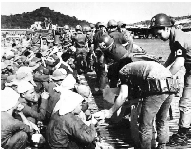
Quân cảnh VNCH phát thực phẩm cho tù binh.

Hung Gia Lợi, Chúng ta đã dành cho dân tộc này biết bao cảm tình trong những ngày Budapest đổ máu cho tự do. Nhưng hình như những người Hung yêu tự do, sống cho sự thật đã không đến nơi này, chỉ có đến đây những cán bộ Cộng sản mang quốc tịch Hung Gia Lợi. Hóa ra người sống cùng người không phải do tương quan của hai chủ thể nhân bản nhưng do chính trị của quốc gia, đảng phái xác định.