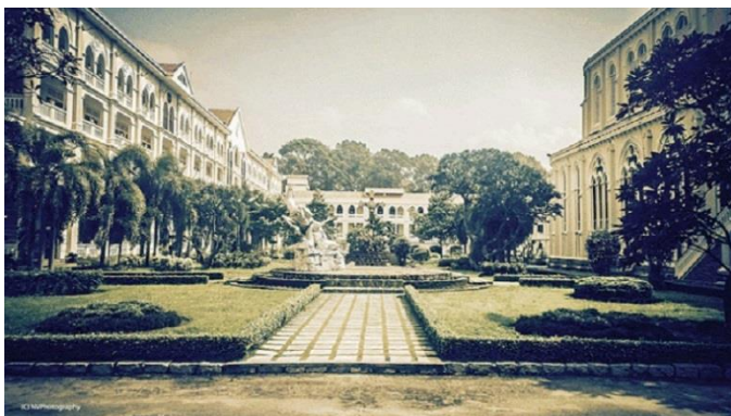
Vườn hoa bên trong Tu viện Saint Paul, phía bên phải là Nhà Nguyện xây dựng 1864, bên trái là văn phòng xây dựng 1947.

Âu theo mô hình các trường học ở Pháp; phần còn lại dành cho các trẻ em bản địa cũng được nhận một nền giáo dục kiểu Pháp để các em có một vị trí thích hợp trong xã hội sau này. Như vậy, khối kiến trúc cô nhi viện trong tu viện Saint Paul lúc này bao gồm một nhà trẻ mồ côi dành cho các cậu bé bản địa dưới 7 tuổi, được nuôi dạy sau đó sẽ được gửi đến trường Adran gần đó; một nhà trẻ mồ côi dành cho các bé gái được chăm sóc cho đến khi họ kết hôn hoặc cho đến khi họ có một vị trí công việc trong xã hội; một ngôi nhà đặc biệt dành cho các cô gái châu Âu, các cô gái công chức hoặc nhân viên, con gái của các thương nhân ở Sài Gòn và các khu vực lân cận. Không chỉ nuôi trẻ cô nhi, Mẹ Benjamin còn mở một nhà nội trú dành cho phụ nữ làm đường lỡ bước có nơi nương tựa và học một nghề nào đó để có thể trở lại cuộc sống bình thường, cũng như mở rộng nhiều cơ sở chăm sóc dạy dỗ trẻ em mồ côi tại khắp Nam kỳ và cả vùng Sài Gòn – Chợ Lớn.