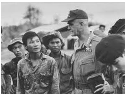
General William C. Westmoreland: *Chúng ta không thua tại Việt Nam, nhưng chúng ta đã không giữ đúng lời cam kết đối với Quân Lực Việt Nam Cộng Hòa. Thay mặt cho quân đội Hoa Kỳ, tôi xin lỗi các bạn cựu quân nhân của Quân Lực Miền Nam Việt Nam vì chúng tôi đã bỏ rơi các bạn. On behalf of the United States Armed Forces, I would like to apologize to the veterans of the South Vietnamese Armed Forces for abandoning you guys.