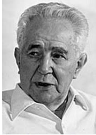
Bí Thư Đảng Cộng Sản Nam Tư Milovan Djilas: *20 tuổi mà không theo Cộng Sản, là không có trái tim, 40 tuổi mà không từ bỏ Cộng Sản, là không có cái đầu