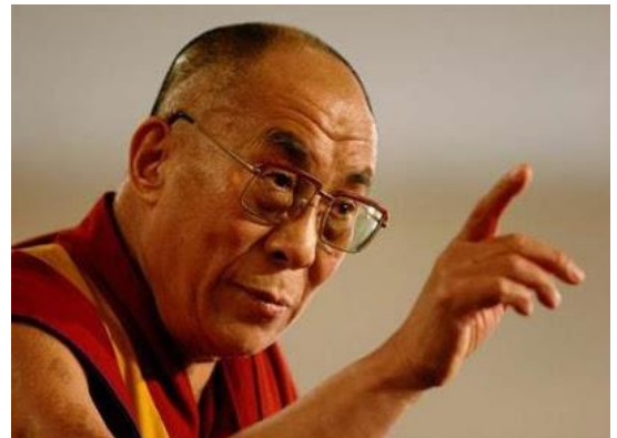
Dalai Lama: *Cộng Sản là loài cỏ dại, mọc trên hoang tàn của chiến tranh, là loài trùng độc, sinh sôi, nảy nở, trên rác rưởi của cuộc đời.