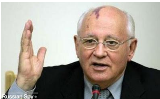
Tổng Bí Thư đảng *Cộng Sản* Liên xô Mr. Mikhail Gorbachev: *Tôi đã bỏ một nửa cuộc đời cho lý tưởng Cộng Sản. Ngày hôm nay tôi phải đau buồn mà nói rằng: **Đảng Cộng Sản chỉ biết tuyên truyền và dối trá.