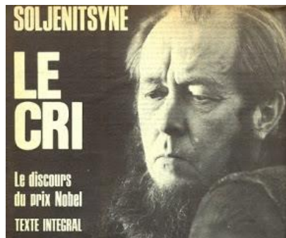
Nhà văn Nga Alexandre Soljenitsym: *Khi thấy thằng Cộng Sản nói láo, ta phải đứng lên nói nó nói láo. Nếu không có can đảm nói nó nói láo, ta phải đứng lên ra đi, không ở lại nghe nó nói láo. Nếu không can đảm bỏ đi, mà phải ngồi lại nghe, ta sẽ không nói lại, những lời nó nói láo với người khác*