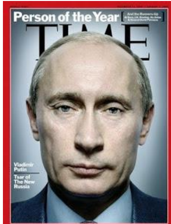
Tổng Thống Nga Vladimir Putin: *Kẻ nào tin những gì Cộng Sản nói, là không có cái đầu. Kẻ nào làm theo lời của Cộng Sản, là không có trái tim.