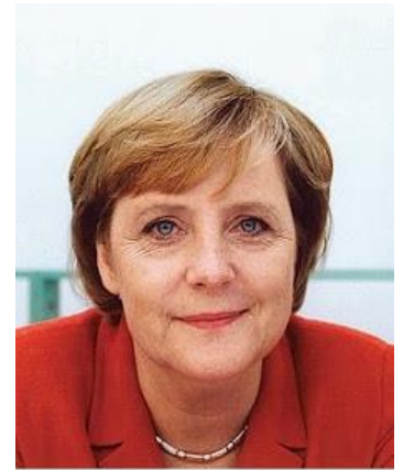
Thủ Tướng Đức Angela Merkel: *Cộng Sản đã làm cho người dân trở thành gian dối