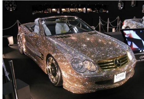
Hay nạm kim cương.