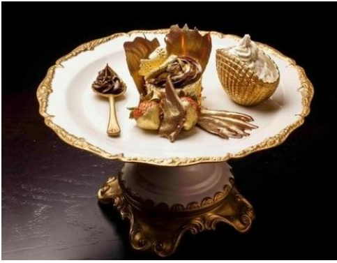
Bánh cupcake dát vàng ở Dubai.

Loại bánh cupcake dát vàng được giới nhà giàu Dubai ưa thích. Do giá thành rất cao nên loại bánh này được liệt kê trong danh sách những món ăn đắt nhất thế giới.