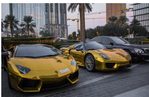
Những chiếc xe dát vàng.

Cũng tương tự như điện thoại, các đại gia Dubai thường chi một khoản tiền lớn lao để dát vàng cho chiếc xe hơi yêu thích của mình. Xe dát vàng được coi là biểu tượng cho sự giàu sang, giai cấp của giới thượng lưu.