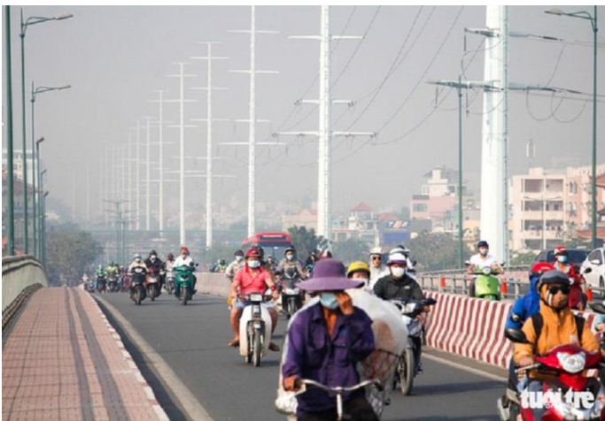
TP.HCM “sương mù” dày đặc từ sáng tới trưa ngày 20-1 vì ô nhiễm

Và thật không may, bây giờ, 2021, tôi đọc lại 10 điều trên, chẳng có điều nào mà không nằm trong danh sách “vẫn như xưa” cả. Thậm chí, 10 điều mà người đời cho là ta thán, mỉa mai nặng nề trên về người Việt bây giờ đã là quen thuộc, khó lòng khiến dân tình “nhột” (như hồi bài viết này mới “chào đời”). Vì bây chừ, hầu như mỗi ngày, mỗi tuần, mỗi tháng, trên bản tin về tội phạm ở các nước Nhật, Hàn, Thái, Đài Loan, Phi Luật Tân, thậm chí là Mỹ, Anh... đều có vài tội phạm có xuất xứ từ “Việt Nam”.