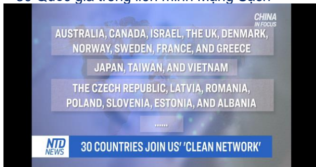
30 Quốc gia trong liên minh Mạng Sạch