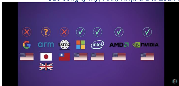
Các công ty Mỹ, Anh, Nhật & Đài Loan ngừng kinh doanh với Hoa Vi

Lần này, chỉ vài hôm khi lệnh cấm của Hoa Kỳ được công bố TSMC (Taiwan Semiconductor Manufacturing Company) đành phải ngừng không nhận đơn hàng từ Hoa Vi. Một quyết định rất khó khăn, bởi hơn 85% Chip có độ tích hợp cao của Hoa Vi là do TSMC sản xuất. (#5), (#6)