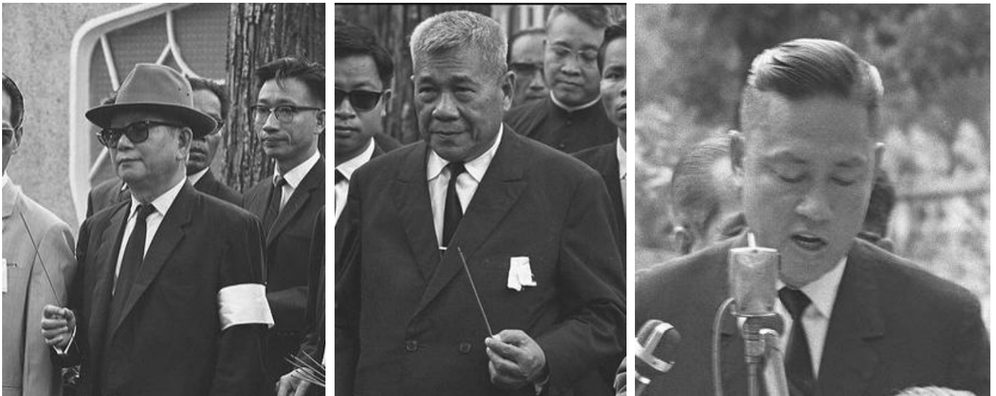
Các ông Phan Khắc Sửu, Trần Văn Hương và Trần Văn Đôn tại đám tang tại đám tang đọc điếu văn tại táng tang.